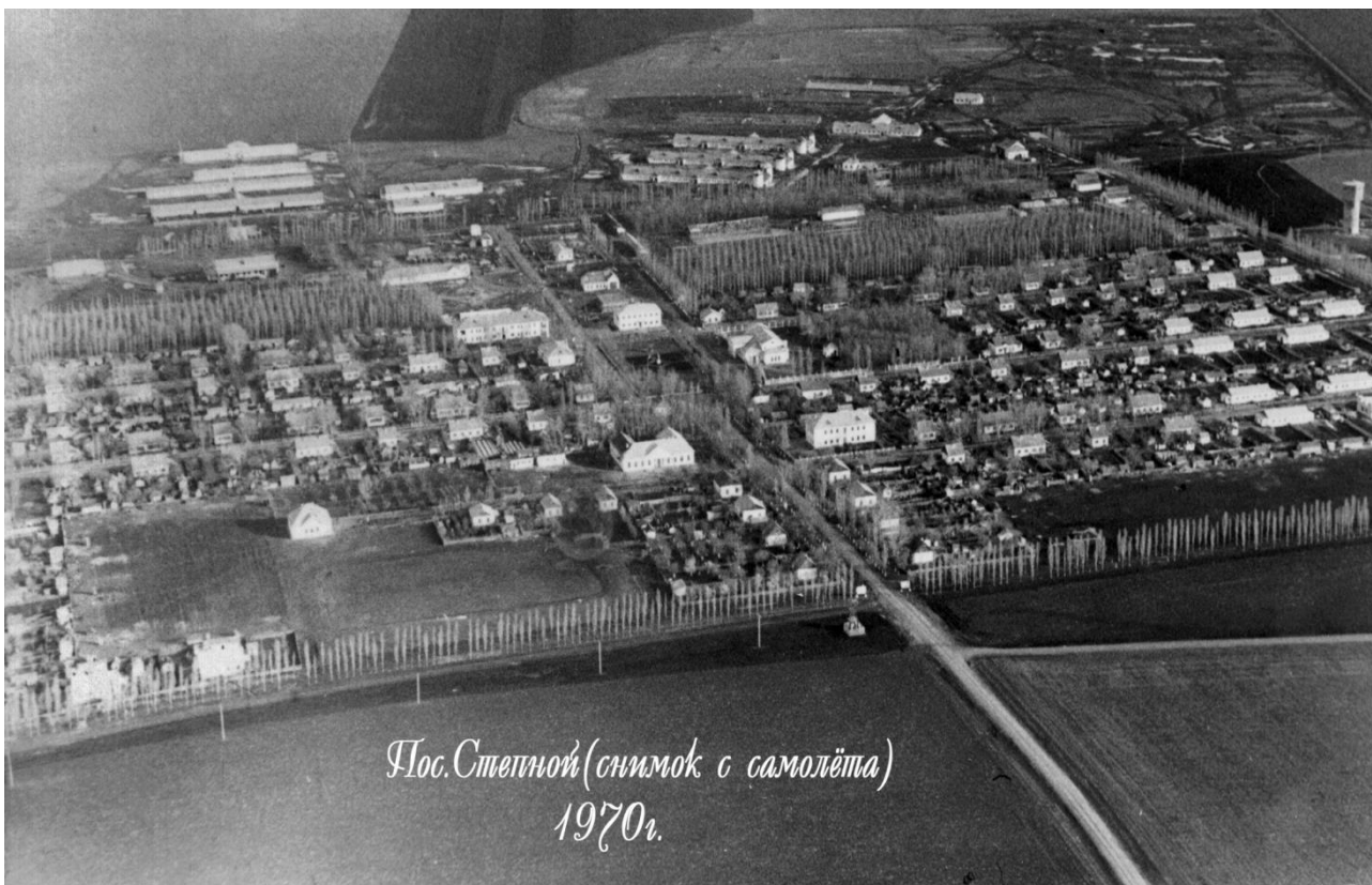
Пос. Степной (снимок с самолёта) 1970г.

Не найду угла другого, Чтоб меня душой завлек Дом родной - село родного. Сердцу милый уголок.