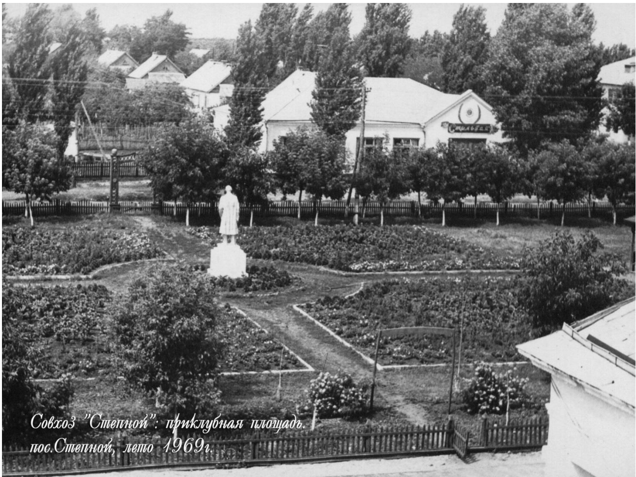
Совхоз "Степной": приклубная площадь, пос. Степной, лето 1969г.